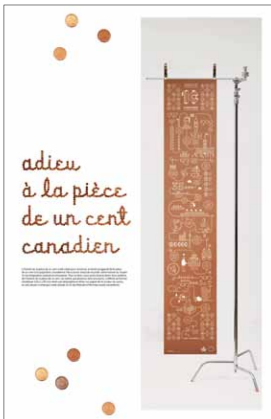
Illustration: Martine Frossard

Illustration réalisée pour un projet d'affiche sur le thème de la quête identitaire: se perdre et disparaître pour exister à nouveau.