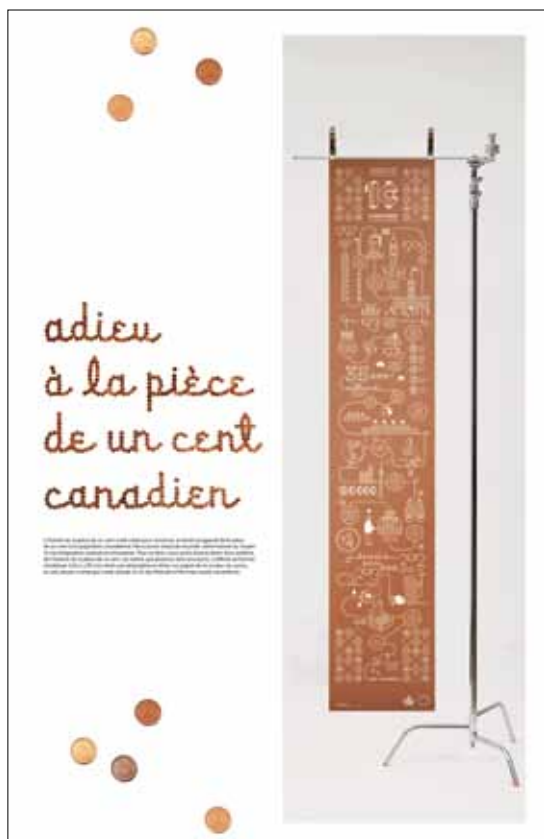
Illustration: Martine Frossard

Illustration réalisée pour un projet d'affiche sur le thème de la quête identitaire: se perdre et disparaître pour exister à nouveau.